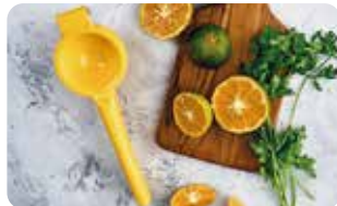
UT 2 EXPRIMIDOR DE LIMONES MANUAL AMARILLO GRANDE L: 24 cm, A: 20,5 cm, H: 8,1 cm, 3,7 Kg