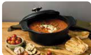
HH 1 HORNO HOLANÉS 1,9 L I 2 QT L: 25,7 cm, A: 20 cm, H: 13,5 cm, 1,9 L, 3,2 Kg