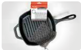
AC 11 MALLA LIMPIADORA 20 cm X 16 cm | 9.7" X 6.3" L: 20 cm, A: 16 cm, H: 0,3 cm