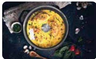
AC 5 TAPA DE VIDRIO TEMPLADO 30 cm | 12" L: 30 cm, A: 30 cm, H: 6,5 cm, 0,97 Kg