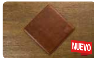
AC 22 PORTA CALIENTE DE CUERO L: 20 cm, A: 0,5 cm, H: 20 cm, 0,095 Kg