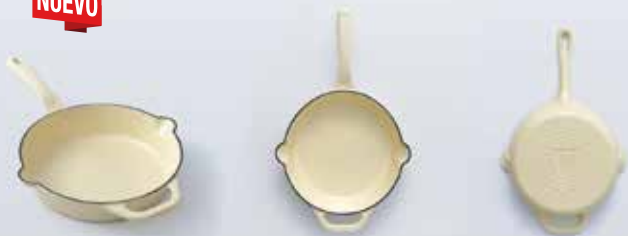
SB 2 SARTÉN 23 cm | 9" 1,5 L