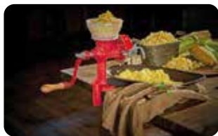
MO 4 MOLINO DE GRANOS ROJO TOLVA BAJA L: 35 cm, A: 16 cm, H: 38,5 cm, 4,5 Kg