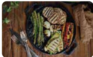
PL 1 PLANCHA PARA ASAR REDONDA 32 cm | 12" L: 38 cm, A: 32 cm, H: 2 cm, 3,8 Kg