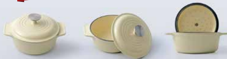
SB 4 HORNO HOLANDES 2 QT • 1,9 L