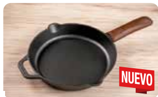
AC 21 MANGO DE CUERO GRANDE L: 19,8 cm, A: 0,5 cm, H: 6,5 cm, 0,037 Kg