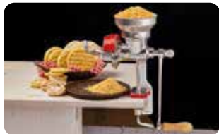
MO 2 MOLINO DE GRANOS TOLVA BAJA ESTAÑADO L: 35 cm, A: 16 cm, H: 38,5 cm, 4,5 Kg