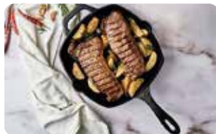
SR 7 SARTÉN PARA ASAR - 25 cm X 25 cm | 10" X 10" L: 44,2 cm, A: 27,5 cm, H: 7,9 cm, 2 L, 2,8 Kg