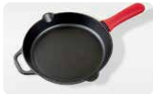
AC 9 MANGO DE SILICONA GRANDE L: 17,8 cm, A: 6,4 cm, H: 2,7 cm, 0,6 Kg