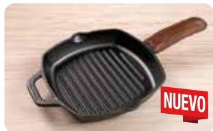
AC 20 MANGO DE CUERO MEDIANO L: 17 cm, A: 0,5 cm, H: 17 cm, 0,034 Kg