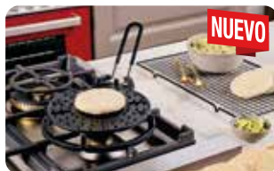
UT 8 PARRILLA PARA AREPA 20 cm | 8" L: 20 cm, A: 33cm, H: 2,5 cm, 2,6 Kg