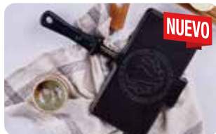
UT 7 SANDUCHERA VICTORIA 27 cm X 14 cm | 10.6" X 5.5" L: 33 cm, A: 17cm, H: 11,4 cm, 2,6 Kg