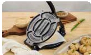
PT 1 PATACONERA - 16 cm | 6.5" L: 20 cm, A: 16 cm, H: 7,5 cm, 3,2 Kg