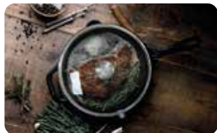
AC 3 TAPA DE VIDRIO TEMPLADO 25 cm | 10" L: 25 cm, A: 25 cm, H: 6 cm, 0,73 Kg