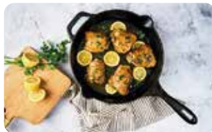
SR 6 SARTÉN - 30 cm | 12" L: 51 cm, A: 33,8 cm, H: 8,1 cm, 3 L, 3,8 Kg