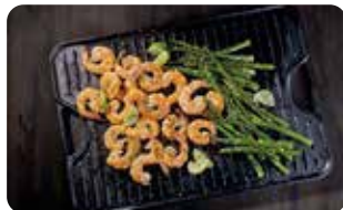
PL 4 PLANCHA PARA ASAR 50 cm X 35 cm | 20" X 14" L: 50 cm, A: 35 cm, H: 2 cm, 8,2 Kg