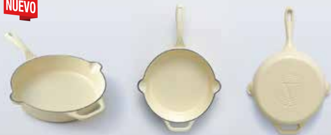
SB 3 SARTÉN 28 cm | 11" 2,6 L