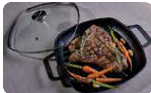
AC 4 TAPA DE VIDRIO TEMPLADO 20 cm | 8" L: 20 cm, A: 20 cm, H: 5,5 cm, 0,48 Kg