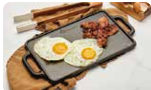
PL 2 PLANCHA PARA ASAR 33 cm X 21cm | 12" X 8" L: 39 cm, A: 21 cm, H: 2 cm, 3,5 Kg