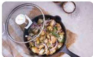
AC 2 TAPA DE VIDRIO TEMPLADO 20 cm | 8" L: 20 cm, A: 20 cm, H: 5,5 cm, 0,48 Kg