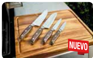
CT 2 CUCHILLO UTILITARIO 13 cm | 5" L: 23,9 cm, A: 1,7 cm, H: 2,3 cm, 0,080 Kg