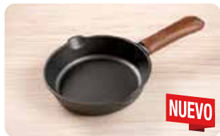
AC 19 MANGO DE CUERO PEQUEÑO L: 14 cm, A: 0,5 cm, H: 5,5 cm, 0,025 Kg