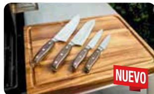
CT 4 CUCHILLO CHEF PROFESIONAL 20 cm | 8" L: 33,2 cm, A: 1,7 cm, H: 4,8 cm, 0,163 Kg