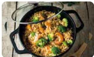
HH 4 HORNO HOLANÉS TAPA DE VIDRIO 3,8 L I 4 QT L: 32 cm, A: 25 cm, H: 15 cm, 3,8 L, 4,4 Kg