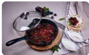
AC 1 TAPA DE VIDRIO TEMPLADO 16,5 cm | 6.5" L: 16 cm, A: 16 cm, H: 5,3 cm, 0,27 Kg