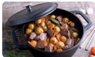
HH 3 HORNO HOLANÉS 3,8 L I 4 QT L: 32 cm, A: 25 cm, H: 15 cm, 3,8 L, 5,4 Kg