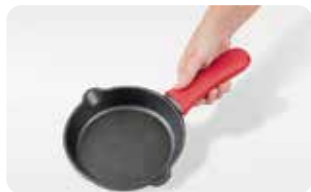
AC 8 MANGO DE SILICONA PEQUEÑO L: 13,5 cm, A: 5 cm, H: 2,3 cm, 0,03 Kg