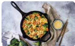
SR 5 SARTÉN - 25 cm | 10" L: 44 cm, A: 28,5 cm, H: 5,4 cm, 2 L, 2,4 Kg