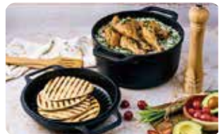
HH 6 COMBO COOKER MULTI-USO 5,7 L I 6 QT L: 34 cm, A: 27 cm, H: 16,4 cm, 7,7 Kg