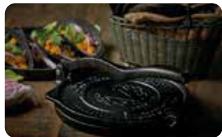
PT 3 PATACONERA HEAVY DUTY - 20 cm | 8" L: 24 cm, A: 20,5 cm, H: 8,1 cm, 3,7 Kg