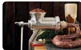
MO 5 MOLINO DE CARNE #10 L: 25,5 cm, A: 12 cm, H: 30 cm, 4,6 Kg