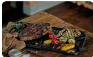
PL 3 PLANCHA PARA ASAR 47 cm X 25 cm | 18.5" X 10" L: 47 cm, A: 25 cm, H: 2 cm, 5 Kg