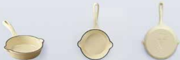
SB 1 SARTÉN 14 cm | 5.5" 0,3 L